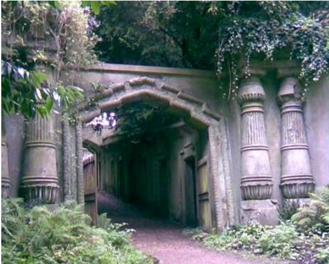
הכניסה ל"שדרה המצרית" בבית הקברות הייגיט

מתקדם בשביל הלאה ומהרהר בתום סויר, איך נעוריו התבזבזו בלהרביץ לאחרים, כדי להראות מי הכי חזק בשכונה. מה היה קורה אילו עשה עליה לארץ? האם היה מתנדב לאצ"ל? האם וינגייט היה מגייס אותו לפלוגות הלילה ואת כלבו מצרף ליחידת "עוקץ"? ובעודי שקוע בהרהורים, השביל ממשיך להתפתל לעבר רום הגבעה, ולפתע מבעד לשיחים מציץ רחוב מעוצב להפליא. זהו Egyptian Avenue והמשכו ב Circle of Lebanon שעצי ארז לבנון עצומים מצלים עליו. אלה אזורים של אולמות גדולים בנויים לתוך סלע הגבעה, שחזיתותיהם אחידות ומעוצבות באלמנטים מצריים או יוונים קדומים.